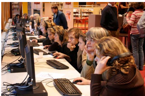
Het digitale ganzenbordspel wordt door alle aanwezigen intensief gespeeld

In de mediatheek namen de ganzenbordspelers achter de computer plaats om de website www.devrouwbeslist.nl te openen en het digitale spel te spelen. Jong en oud dobbelden in tweetallen door het online ganzenbordspel. De leerlingen bleken meer verstand te hebben van de hedendaagse tech-