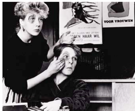
5. tegen haar wil IIAV - Collectie. © Maya Peijic.