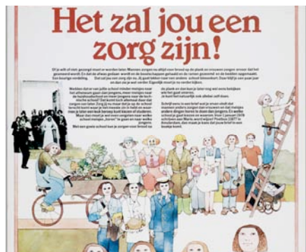
4. marie wordt wijzer IIAV - Collectie. © Annet Planten