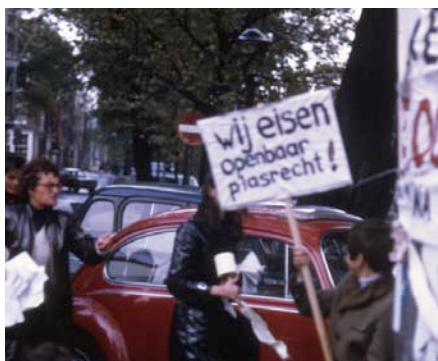
1. Plasrecht IIAV-Collectie. © J. Timmer.

Ik hoop dat door het Ganzenbordspel de verschillende vormen van ongelijkheid tussen jongens en meisjes bespreekbaar worden gemaakt. Door dit project kunnen we daar op een ludieke manier mee bezig zijn.”