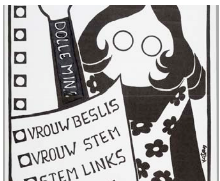
2. stem een vrouw IIAV - Collectie. © Koten.