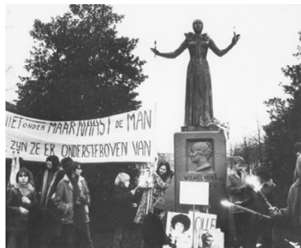
3. niet onder maar naast de man IIAV - Collectie © Eva Besnyö/Maria Austria Instituut