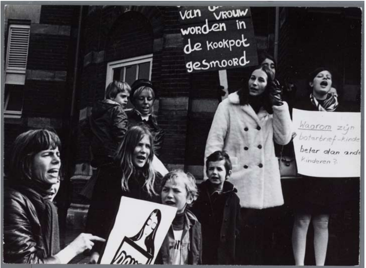
F149-96b 1970 congres van Dolle Mina. Vrouwen met leuzen.