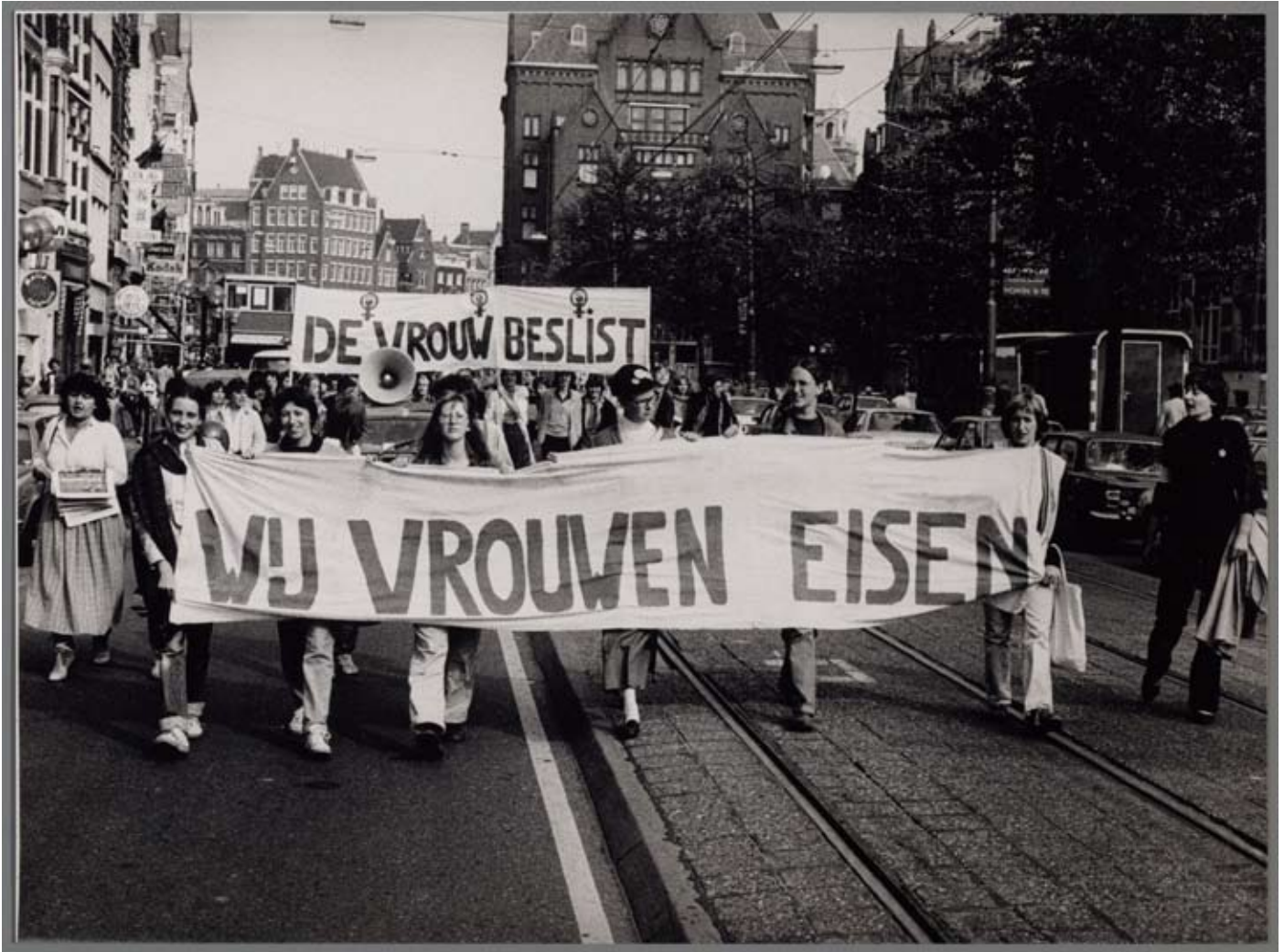
Amsterdam. 1970 abortusdemonstratie