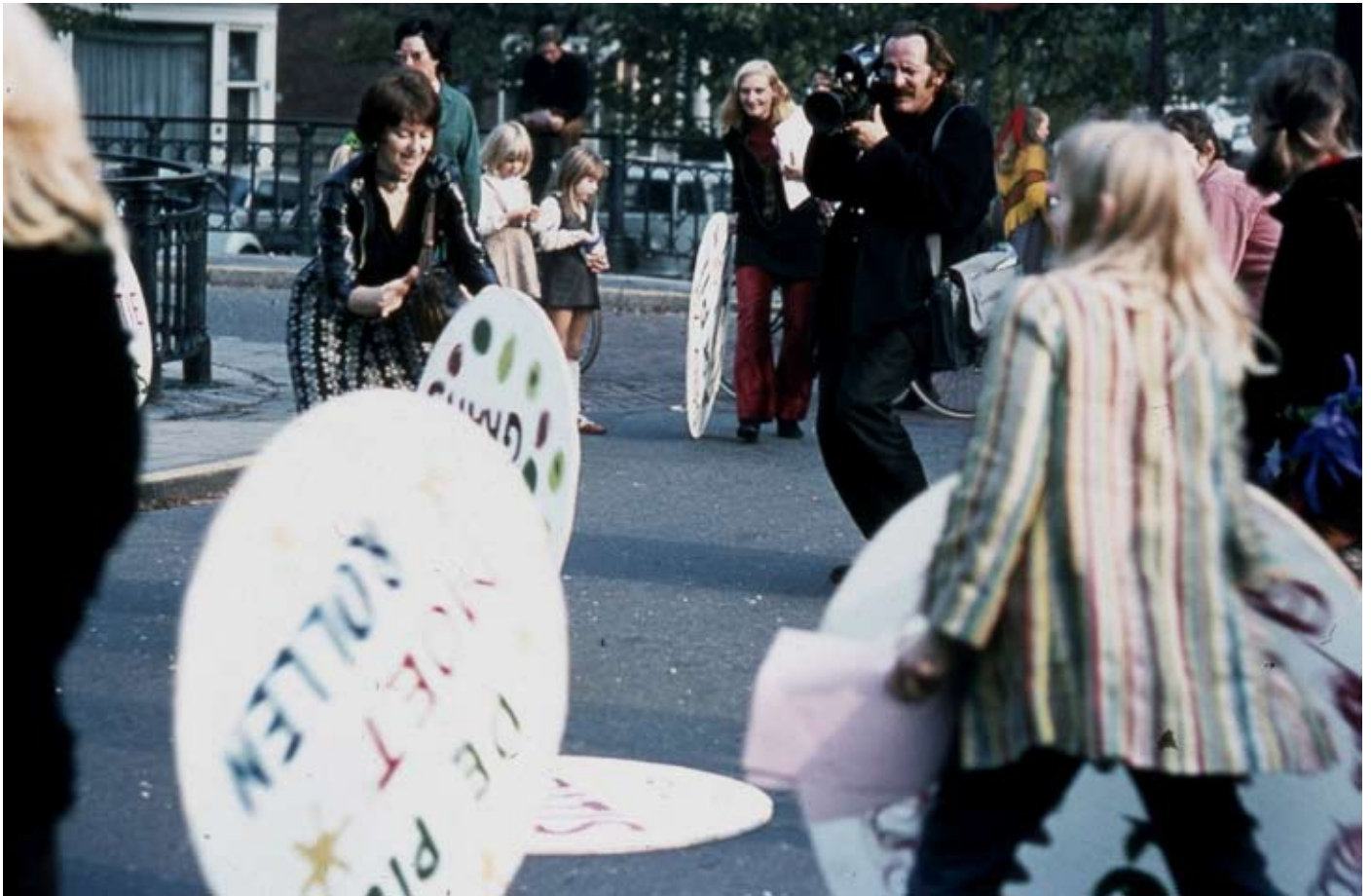
Foto 100010736 ( pilactie) Pilactie Dolle Mina. Amsterdam 1970